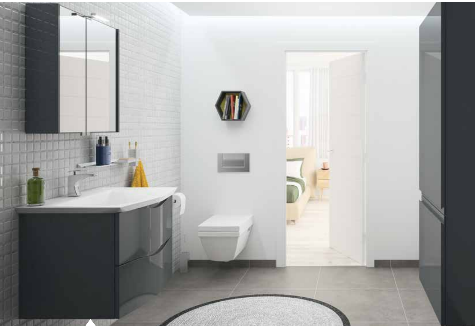
10 LARGEUR 76 CM - GRAPHITE BRILLANT - PLAN VASQUE EN MARBRE RECONSTITUÉ BRILLANT.

LARGEURS DISPONIBLES* 70 cm 120 cm 140 cm PROFONDEUR* 56 cm