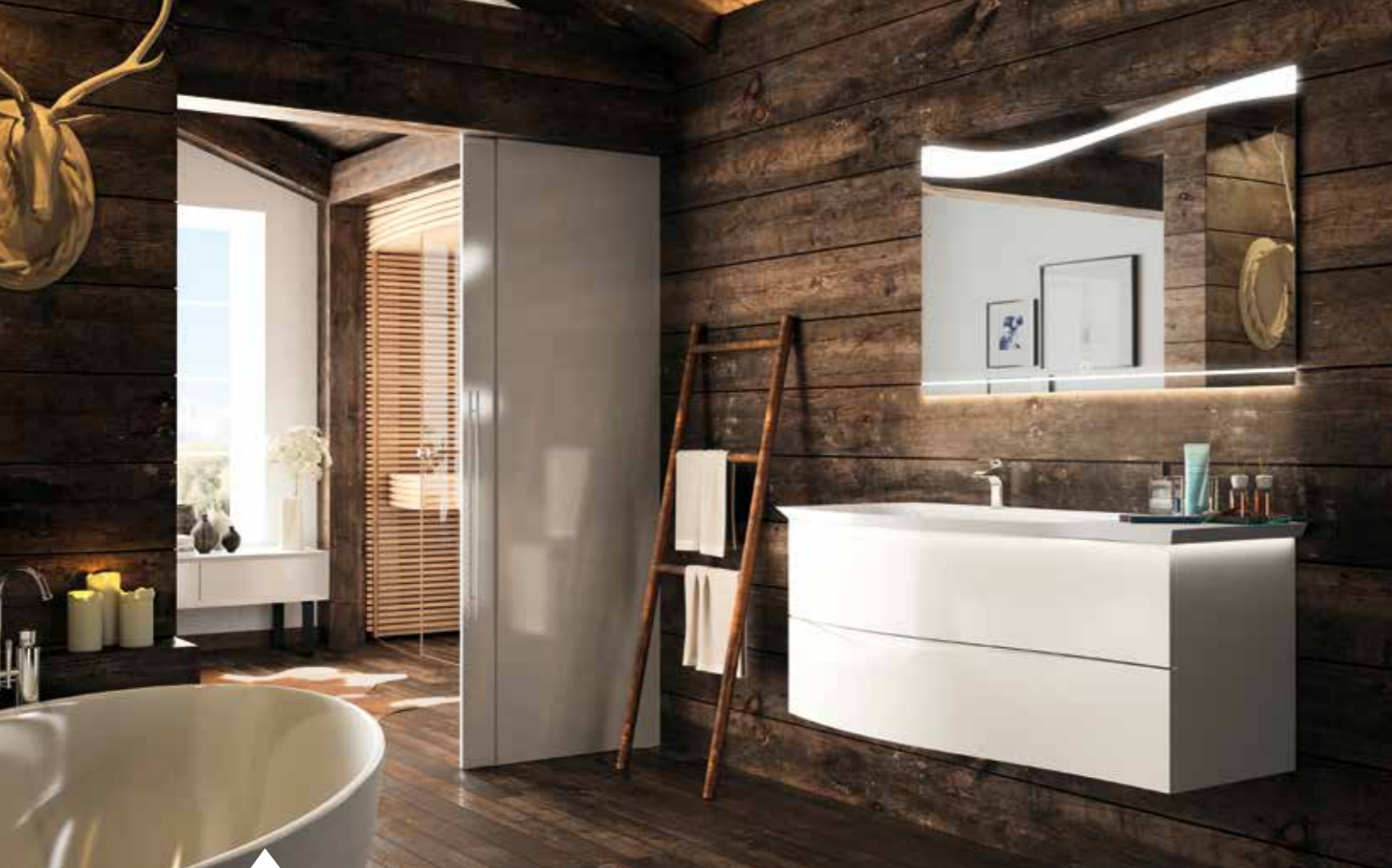
LARGEUR 126 CM - COTON BRILLANT - PLAN VASQUE EN MARBRE RECONSTITUÉ BRILLANT GAUCHE.